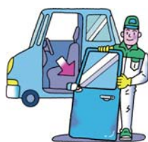
適正処理された使用済み自動車から再利用できる部品を取り外します。

リサイクル部品には、使用済の車から取り外され点検・清掃・美化が施された再利用の部品「リユースパーツ」（中古部品）と、摩擦や劣化した部品を新品と交換して、ほぼ新品同様にまで復元・修復された「リビルトパーツ」（再生部品）があります。地球に優しくあるために、リサイクル部品を積極的に活用しましょう。