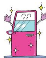
点検・清掃・美化を施された