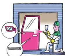
部品生産工場等で点検・清掃・美化、修理・部品の交換などを行います。